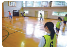
軽スポーツ／ボランティア部