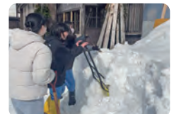
除雪ボランティア