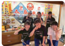
地域探究サークル「僕達 杉の子 元気の子」